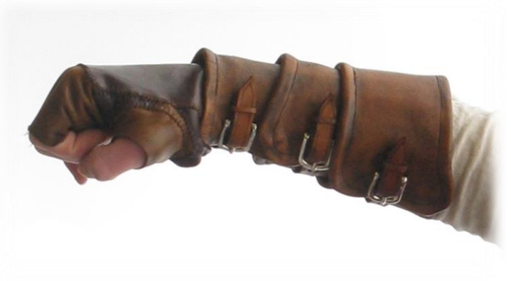
Sluiting d.m.v. sluitingen