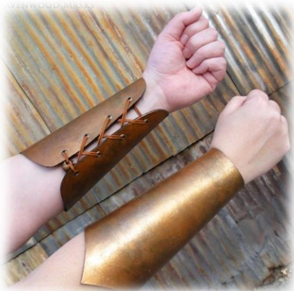
Sluiting d.m.v. touw